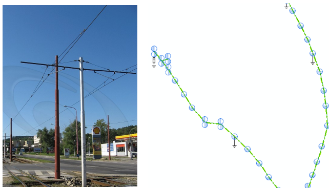
Obr. 2. Spracovanie siete trakčného vedenia pre tvorbu digitálnej dokumentácie.

3. Tretiu finálnu fázu projektu GIS predstavuje transformácia všetkých dostupných údajov energetických zariadení do cieľového projektu. Na trhu je viacero produktov pre tvorbu GIS. V našich podmienkach pre spracovanie objektov líniovej infraštruktúry sa s pozitívnymi referenciami osvedčila štruktúra ArcFM UT, ktorá je vytvorená priamo pre spracovanie NN, VN elektrických rozvodov a ich objektov (Obr.2).